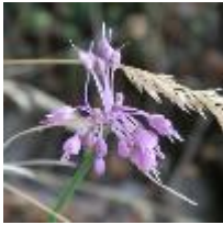
Allium carinatum subsp. pulchellum