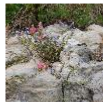
Polygala vulgaris -