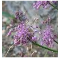
Allium carinatum subsp. pulchellum