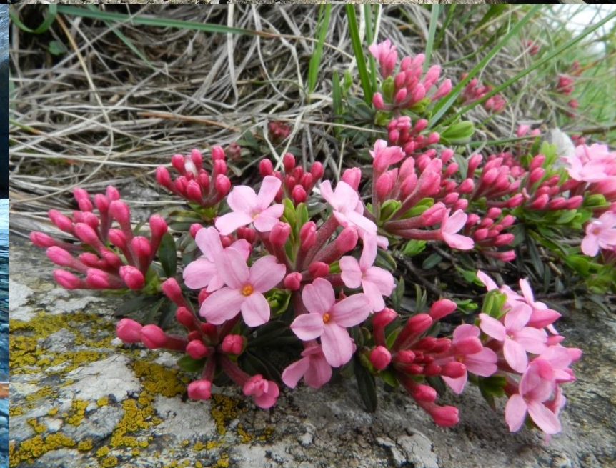
Parco Regionale Beigua – UNESCO Global Geopark