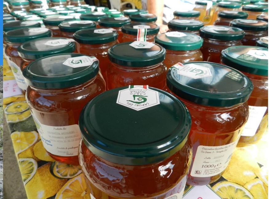
Parco Regionale Antola