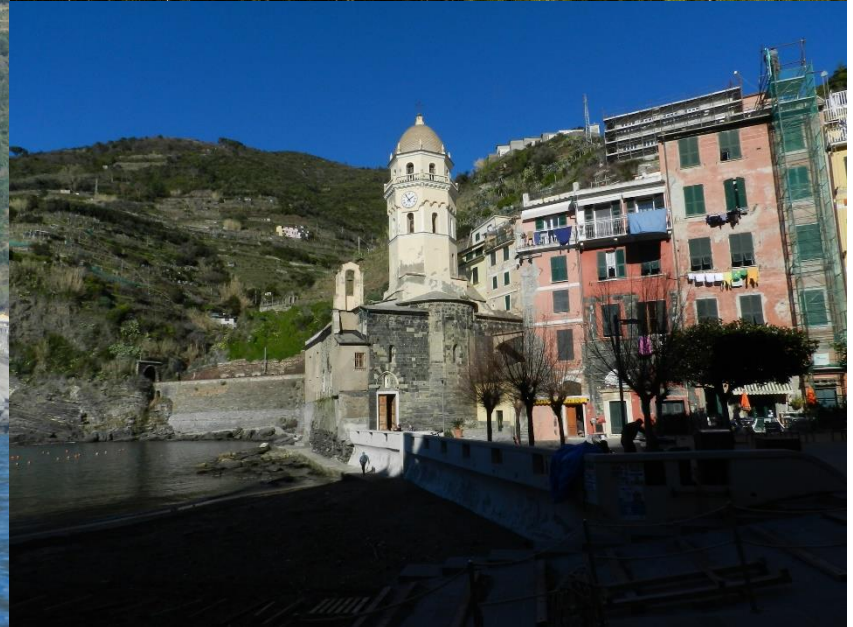
Parco Nazionale e AMP 5 Terre