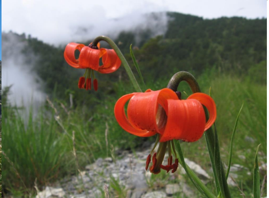
Parco Regionale Alpi Liguri